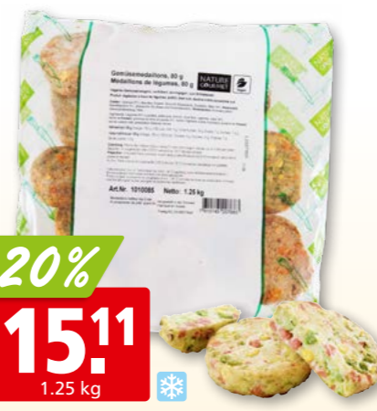
Médallions de légumes Nature Gourmet, 80 g surg.