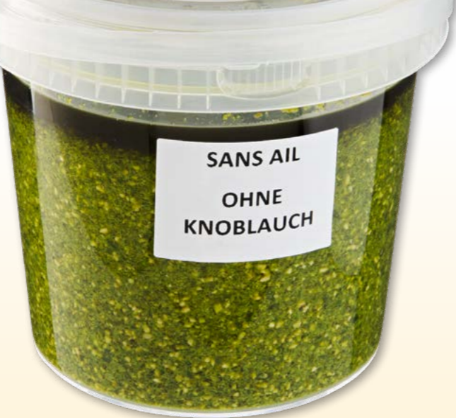
Pesto alla genovese sans ail