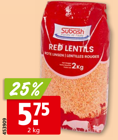
Subash Rote Linsen