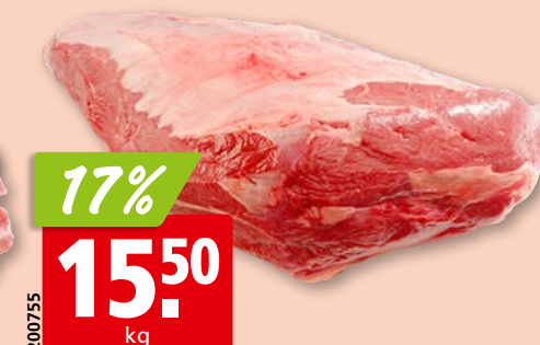
Rinds-Voessen Gastro frisch, von der Haxe aus der Schweiz/Deutschland, ca. 3 kg (ungeschnitten: 13.94/kg)