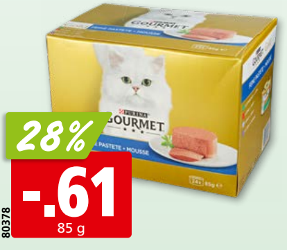
Purina Gourmet Gold Assortiment feine Pastete (Kaninchen, Rind, Kalb, Lamm), 24 x