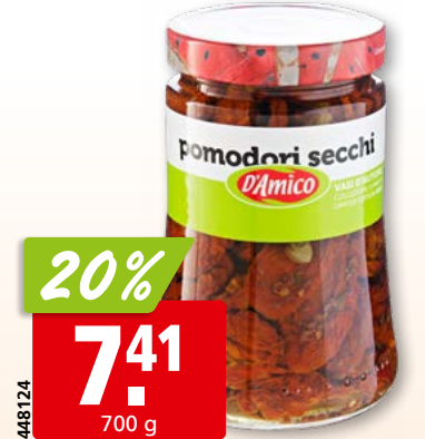
D'Amico getrocknete Tomaten