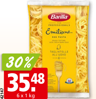
Barilla Tagliatelle 5 Eier Nr. 229 Emiliane Chef