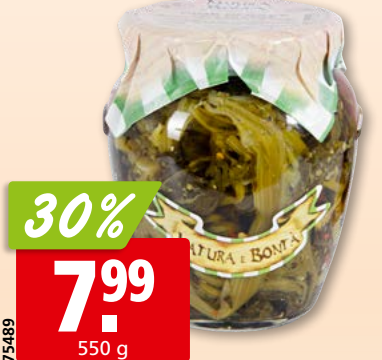
Natura e Bontà Cime di Rape