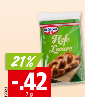
Dr. Oetker Backhefe 36 x