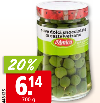
D'Amico Olive Dolci di Castelvetro entsteint