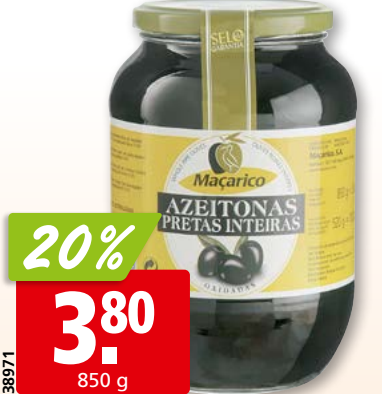
Maçarico schwarze Oliven nicht entsteint