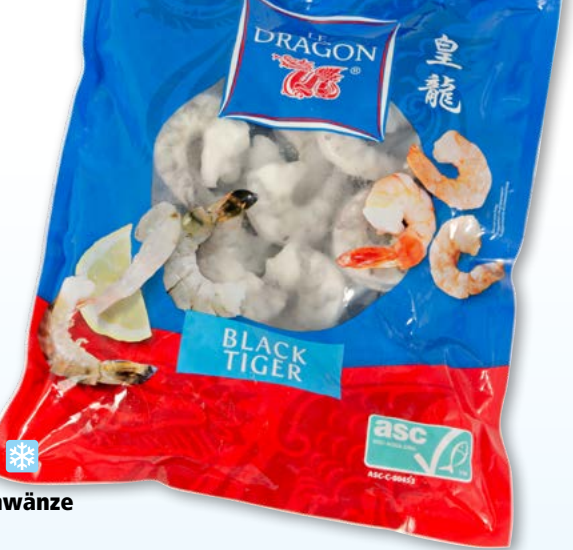
Le Dragon Krevettenschwänze Black Tiger, 21-25 ASC, geschält, tk