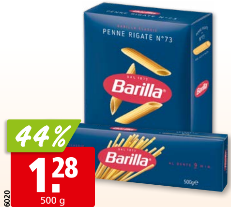
Barilla Teigwaren Spaghetti Nr. 5 oder Penne Rigate Nr. 73 6 x