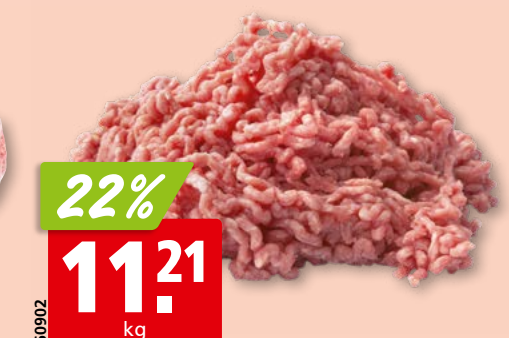
Rinds-Dicke Schulter oder Schulterfilet Gastro frisch aus der Schweiz/Deutschland/Österreich