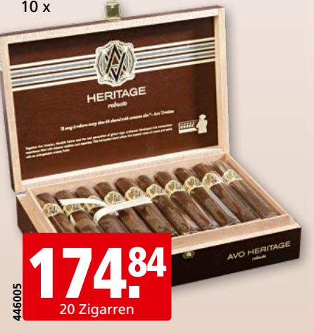
Avo Heritage Robusto