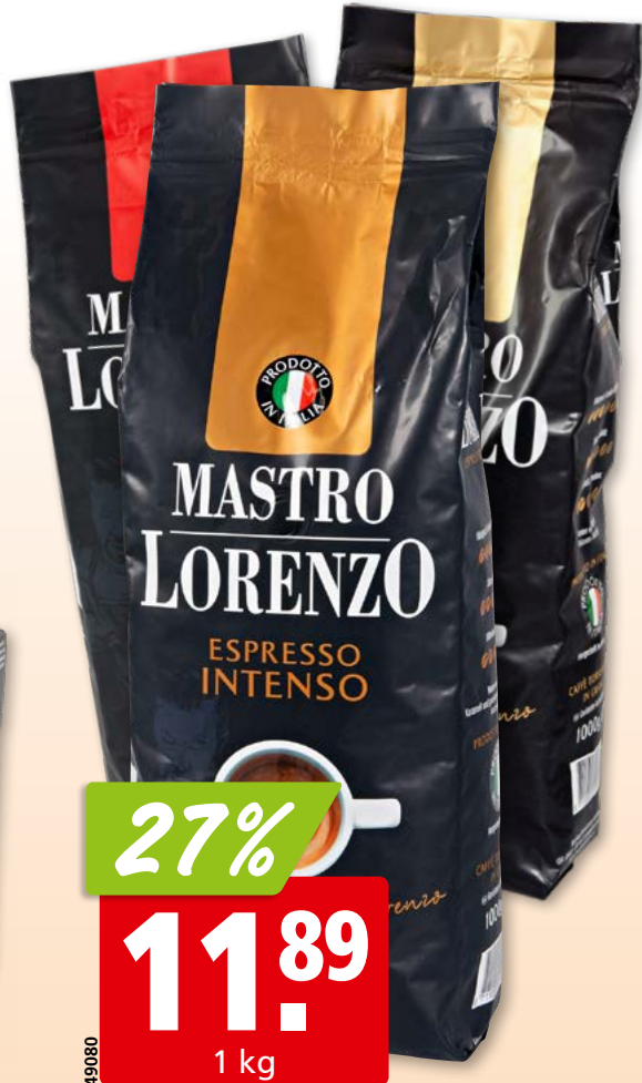
Espresso Club Rossa Bohnen