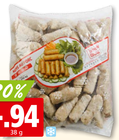
Nem mit Schweinefleisch tk