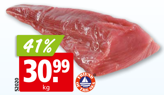
Thunfischfilet Sashimi aus dem Mittleren Ostpazifik