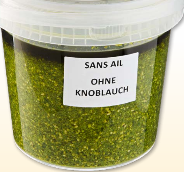
Pesto alla Genovese ohne Knoblauch