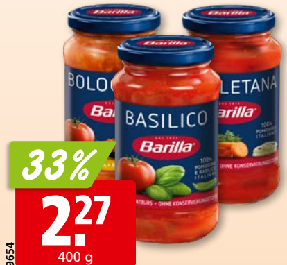
Barilla Tomatensauce Basilico, Bolognese oder Napoletana 3 x