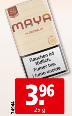
Maya Original Roll Your Own