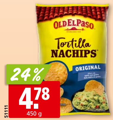
Old El Paso Nachips