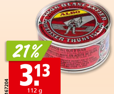
Albo weisser Thon in Olivenöl