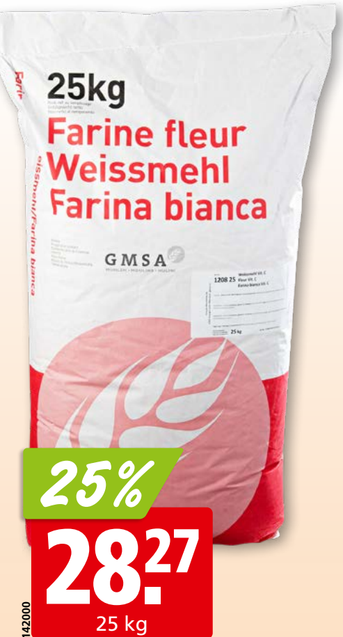
GMSA Weissmehl mit Vitamin C, Typ 400