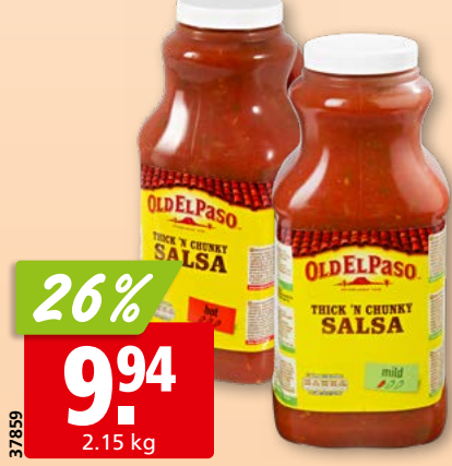
Old El Paso Chunky Salsa mild oder hot