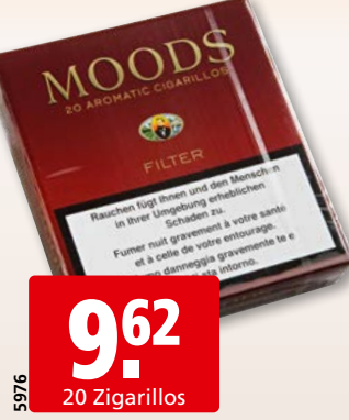
Dannemann Moods Filter