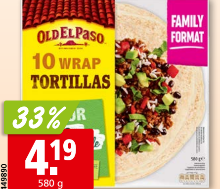
Old El Paso Wrap Tortillas Family Pack