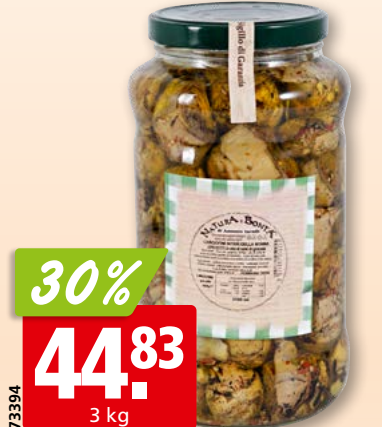
Natura e Bontà Carciofini della Nonna alla Brace