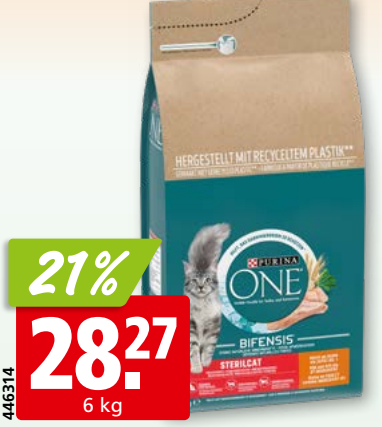
Purina One Katzenfutter Adult Sterilcat, mit Poulet