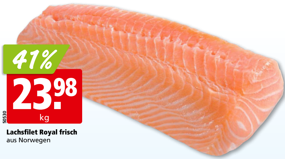
Lachsfilet Royal frisch aus Norwegen