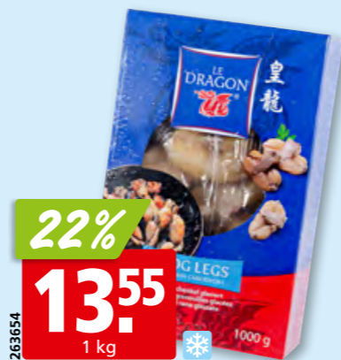
Cuisses de grenouilles Le Dragon, 30-40 surg., 10 x