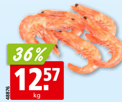
Crevettes, 25-35 cuites, réfrigérées de l'Equateur/Venezuela