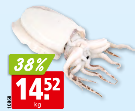
Seiche blanche dégelée, de l'Atlantique Centre-Est