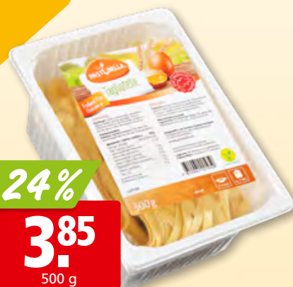
Tagliatelle Pastinella, 6 mm