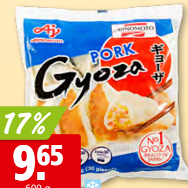
Gyoza au porc Ajinomoto surg.