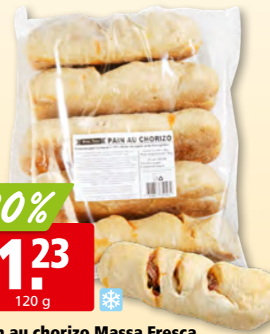
Pain au chorizo Massa Fresca surg., 5 x