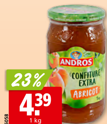
Confiture Extra d'abricot Andros