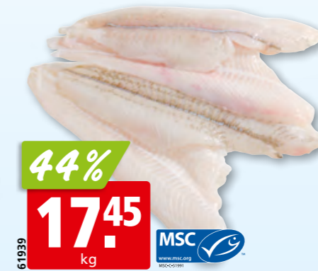
Filets de carrelet frais de l'Atlantique Nord-Est