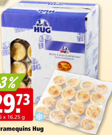
Miniramequins Hug surg.