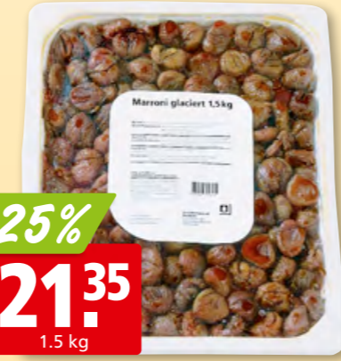
Marrons glacés pasteurisés