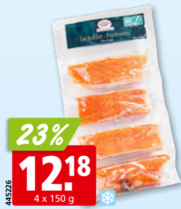
Pavés de saumon ASC, sans peau, de Norvège, surg., 12 x