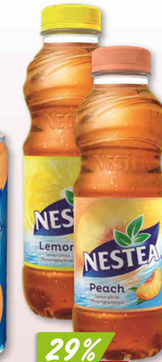
Nestea peach ou lemon 24 x