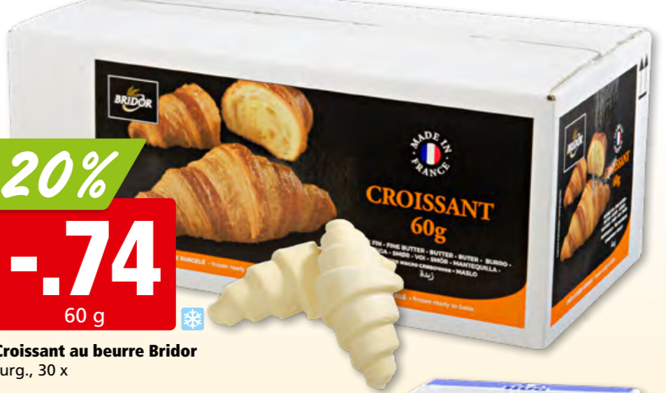
Croissant au beurre Bridor surg., 30 x