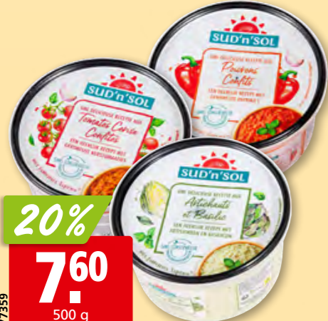
Tapena Sud'n'sol artichauts au basilic, tomates cerises au basilic ou poivron rouge