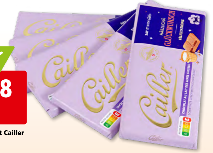
Chocolat au lait Cailler 12 x 5