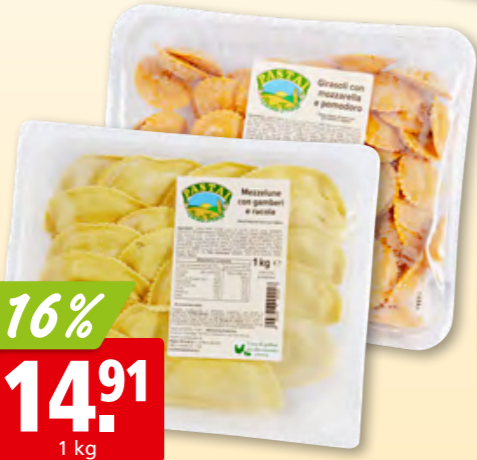
Mezzaluna rucola e gamberetti ou pomodoro e mozzarella