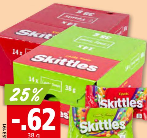
Skittles crazy sour ou fruits, 14 x