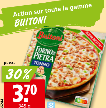
Pizza Forno di pietra au thon surg.