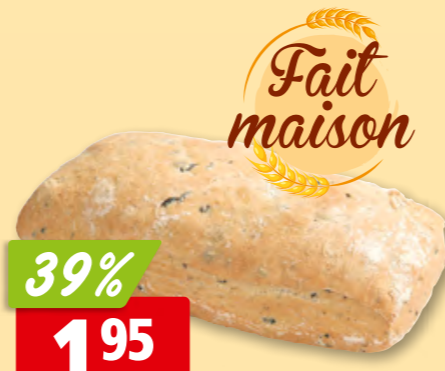
Pain aux olives de notre boulangerie artisanale