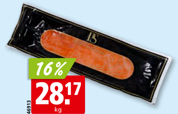
Saumon fumé, 800-1200 g tranché, de Norvège