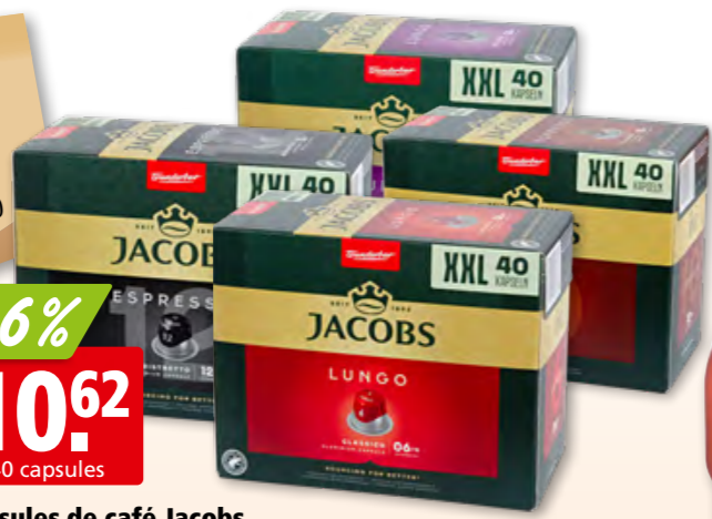
Capsules de café Jacobs diverses sortes