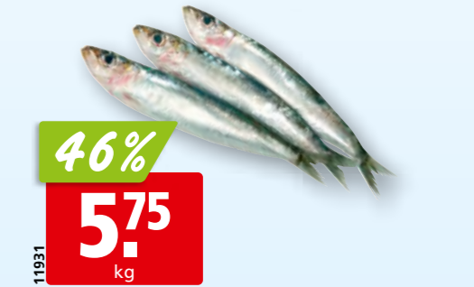
Sardines fraîches de l'Atlantique