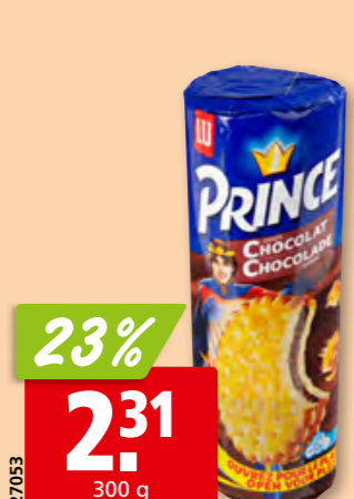
Prince goût chocolat LU 4 x