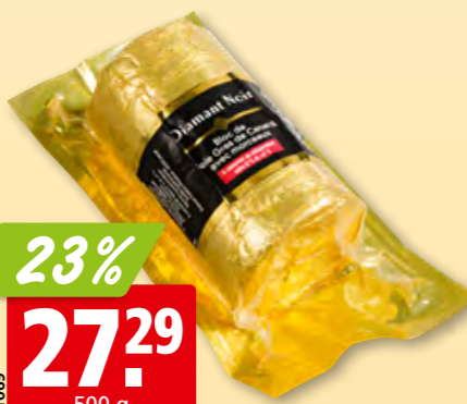
Bloc de foie gras de canard Diamant Noir avec 30% de morceaux