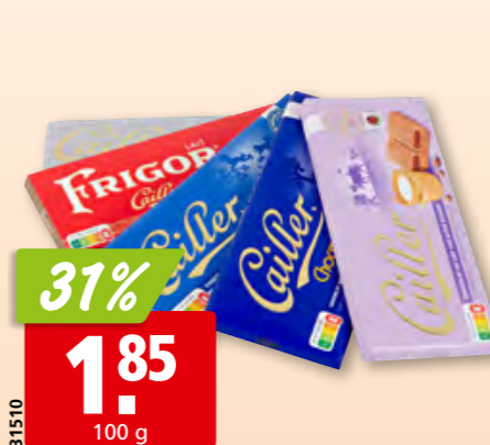
Tablettes leader Cailler assortiment, 5 x