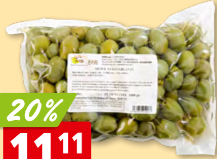
Olive verdi giganti