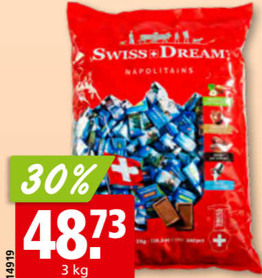
Napolitains Swiss Dream