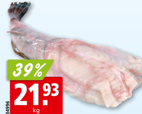
Queue de lotte fraîche, 1-2 kg de l'Atlantique Nord-Est