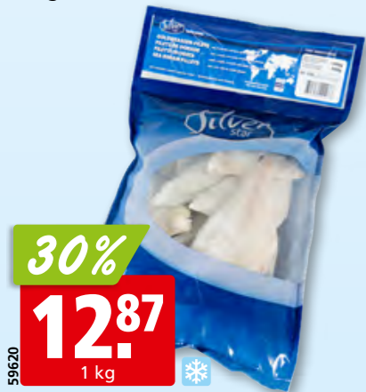
Filets de dorade Silver Star, 80-100 g surg.