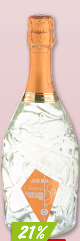
Spumante Cuvée Lounge Astoria Brut, 6 x