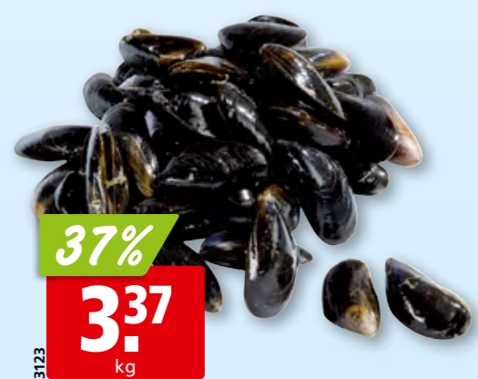
Moules fraîches des Pays-Bas, 2 kg