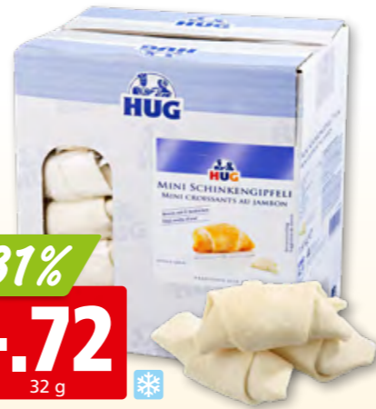
Minicroissant au jambon Hug surg., 50 x