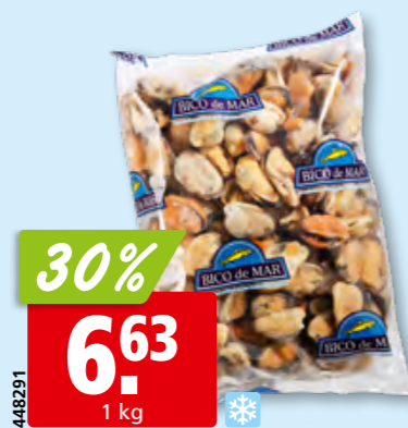
Moules décoquillées, cuites, surg.