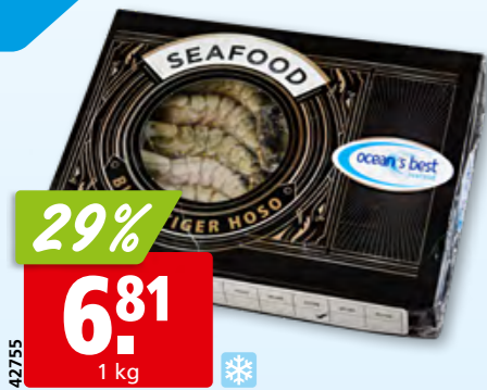
Crevettes Black Tiger Ocean's Best, 21-30 surg., 10 x

Arrivages de poisson frais dès mardi midi.