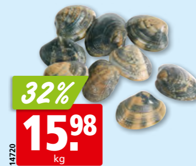
Veraces fraîches grosses, d'Italie