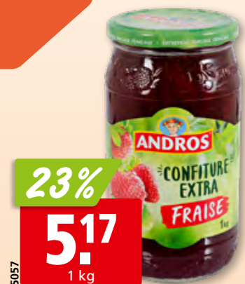
Confiture Extra de fraise Andros