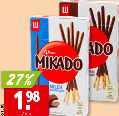
Mikado LU chocolat au lait ou noir, 3 x