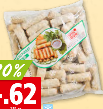
Nem au poulet SFPA surg., 50 x