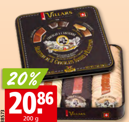
Chocolat à l'ancienne Villars boîte en métal