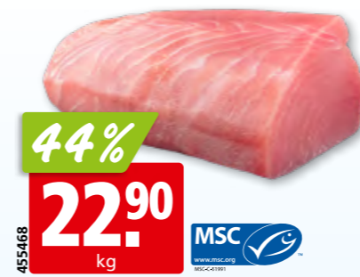
Filet de thon germon du Pacifique Centre-Est