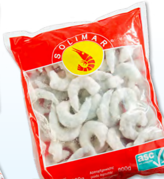
Queues de crevettes Vannamei Solimar, 16-20 décortiquées, ASC, surg., 10 x