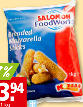
Sticks de mozzarella Salomon FoodWorld panés, 33-36 pièces, surg.