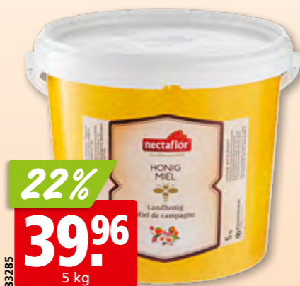
Miel de campagne Nectaflo