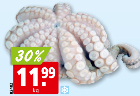
Poulpe Fesba, 2-3 kg nettoyé, surg.