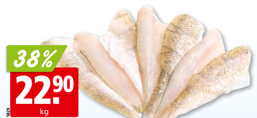
Filets de perche fraîche, 10-20 g avec peau, d'Estonie