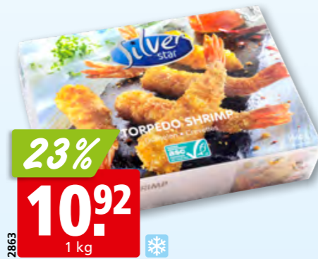
Crevettes Torpedo Silver Star panées, ASC, surg.