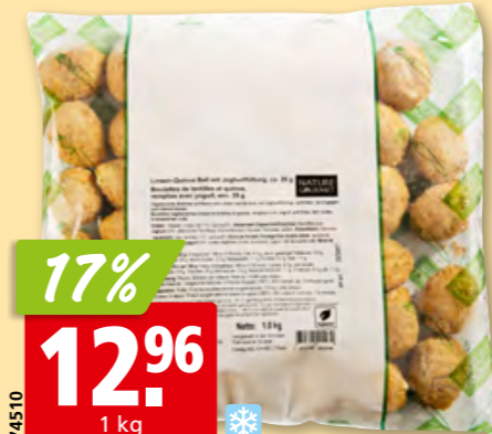
Boulettes de lentilles-quinua au yogourt Nature Gourmet surg.