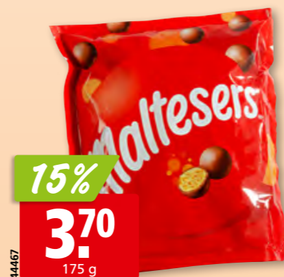
Maltesers classic 3 x