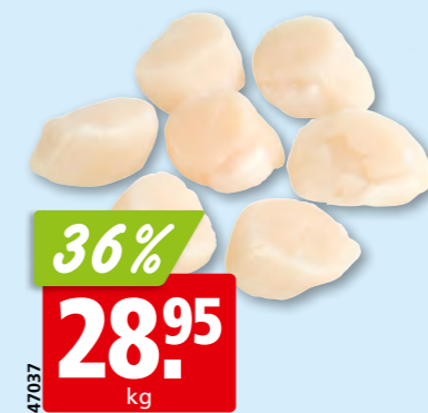
Noix de St-Jacques sans corail (préparation) de l'Atlantique Nord-Ouest