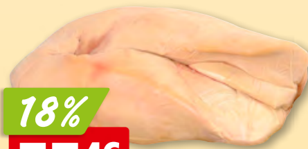
Foie gras de canard 1er choix frais cru, de France