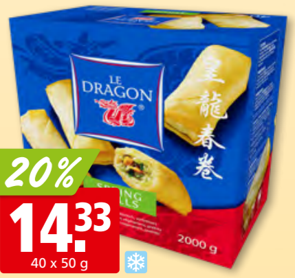
Rouleaux de printemps aux légumes Le Dragon , surg.