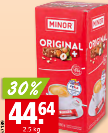
Minor original Maestrani env. 480 pièces