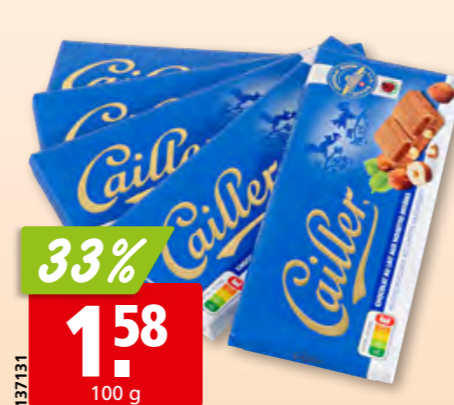
Chocolat au lait & noisettes Cailler 8 x 5