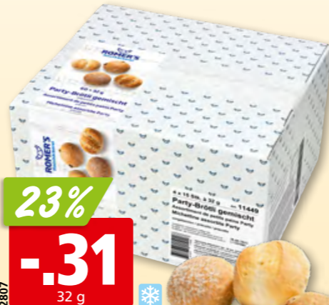
Petit pain Party Romer's assortiment, surg., 60 x