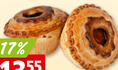
Pâtés vaudois Le Croustillon