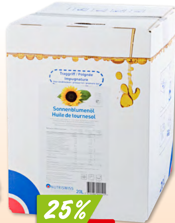
Huile de tournesol High oleic Nutriswiss