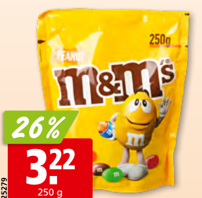
M&M's peanut 3 x