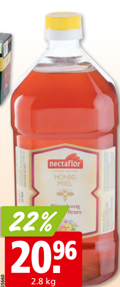
Miel de fleurs Nectaflo liquide