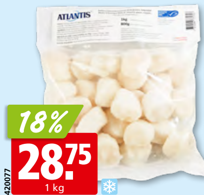
Noix de St-Jacques Atlantis, 10-20 sans corail, MSC, des USA, surg.