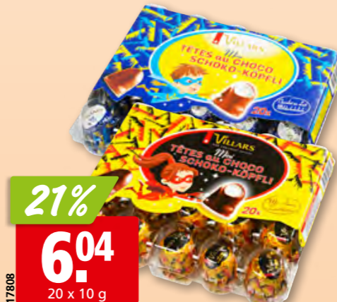
Minitêtes au choco Villars original ou au lait