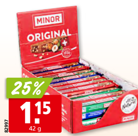
Minor original 44 x