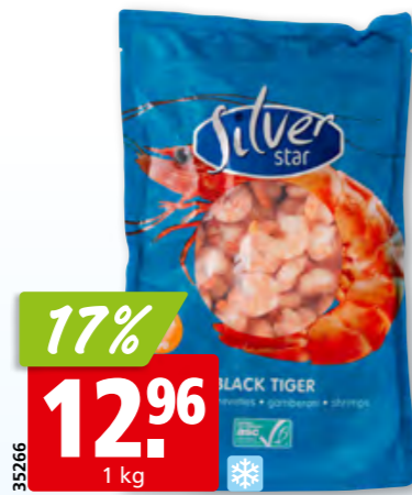
Crevettes cocktail Black Tiger Silver Star, 90-120 ASC, surg., 10 x