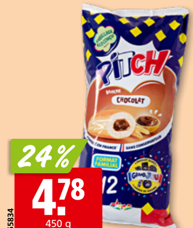
Brioche au chocolat Pitch Pasquier