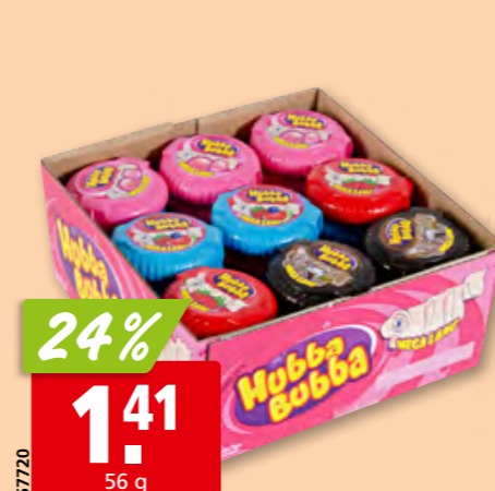
Bubble tape Hubba Bubba assortiment, 36 x