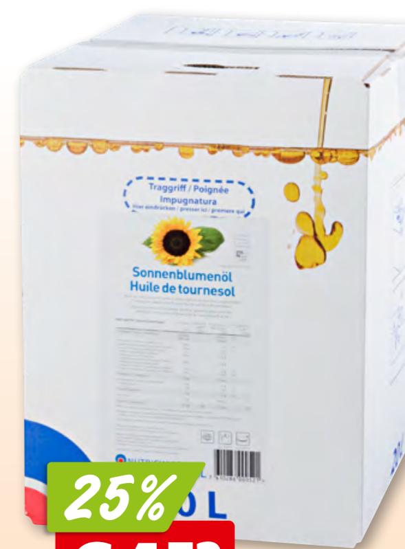
Belfina Gastrosoft Pflanzenöl zum Frittieren