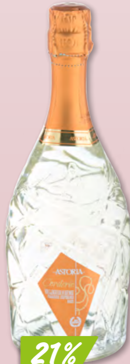
Spumante Cuvée Astoria Lounge Brut, 6 x