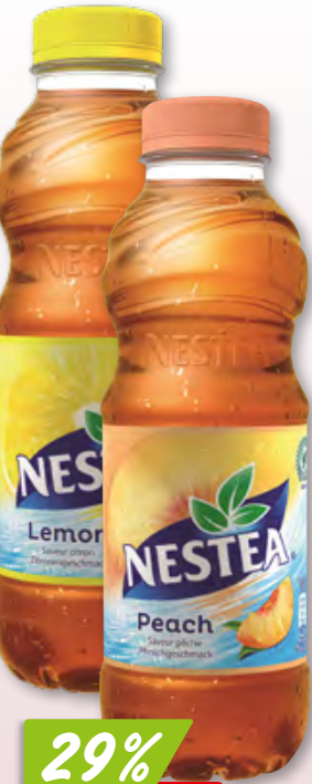
Nestea Peach oder Lemon 24 x