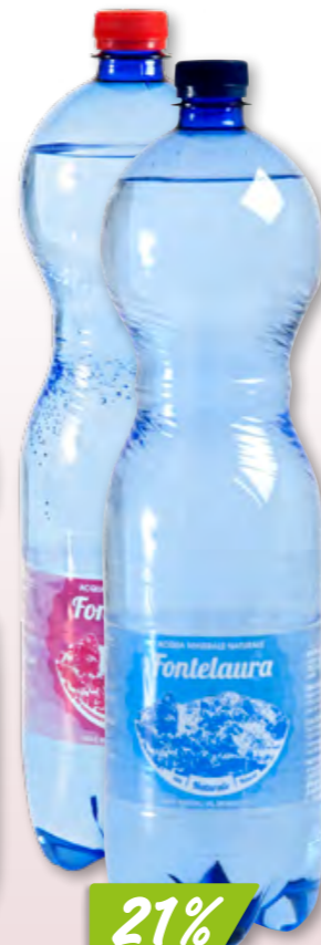
Fontelaura Naturale oder Frizzante 4 x 6