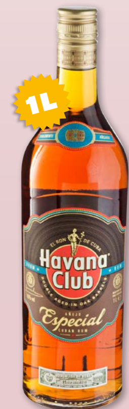
Havana Club Añejo 3 años 37.5% vol., 6 x