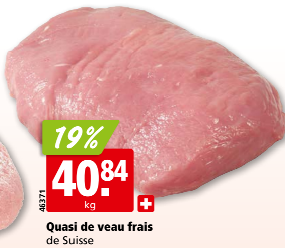
Quasi de veau frais de Suisse