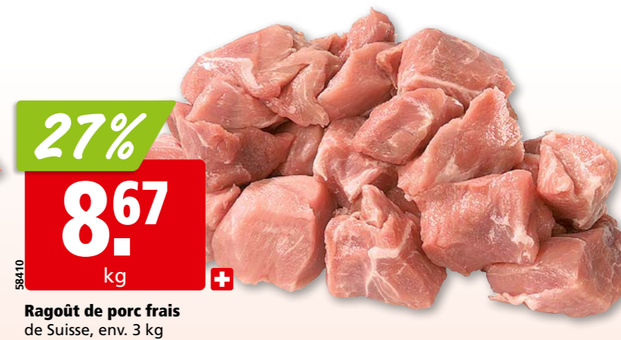
Ragoût de porc frais de Suisse, env. 3 kg