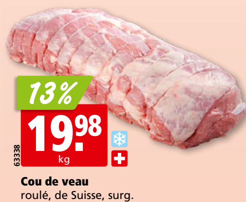
Cou de veau roulé, de Suisse, surg.