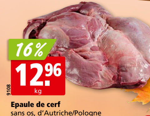
Epaule de cerf sans os, d'Autriche/Pologne