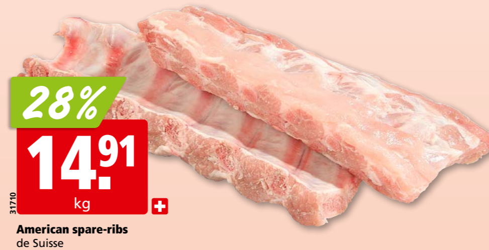
American spare-ribs de Suisse