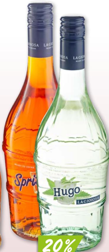
Spritzoso La Gioiosa 12 x 2