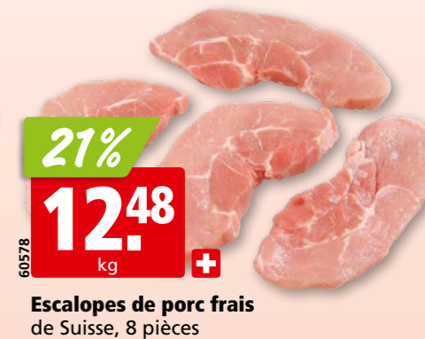
Escalopes de porc frais de Suisse, 8 pièces