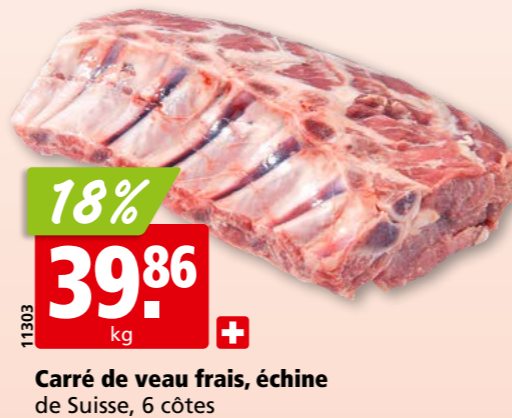
Carré de veau frais, échine de Suisse, 6 côtes