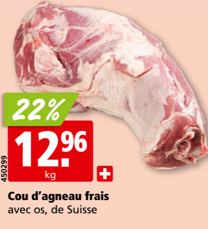
Cou d'agneau frais avec os, de Suisse