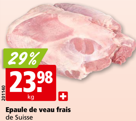
Epaule de veau frais de Suisse