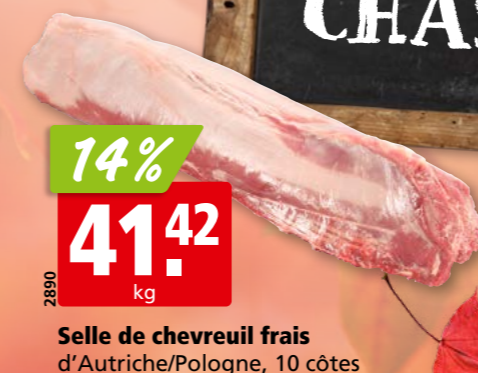
Selle de chevreuil frais d'Autriche/Pologne, 10 côtes