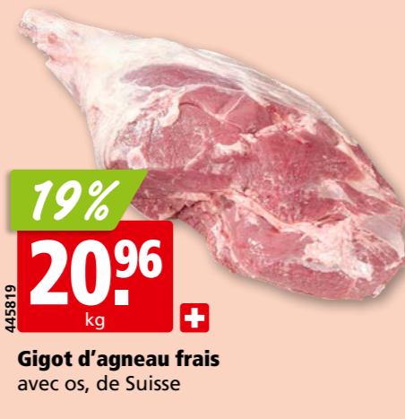
Gigot d'agneau frais avec os, de Suisse