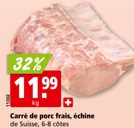
Carré de porc frais, échine de Suisse, 6-8 côtes