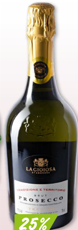
La Gioiosa Hugo ou Spritzoso 6 x