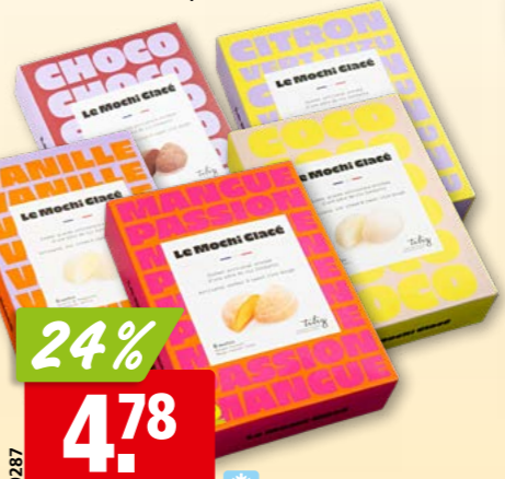
Nuii diverses sortes, 20 x