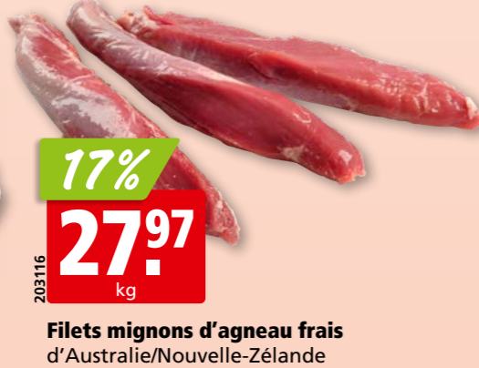
Filets mignons d'agneau frais d'Australie/Nouvelle-Zélande