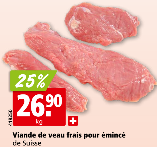
Viande de veau frais pour émincé de Suisse