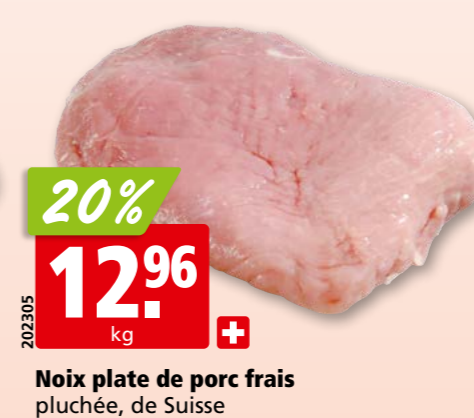
Noix plate de porc frais pluchée, de Suisse