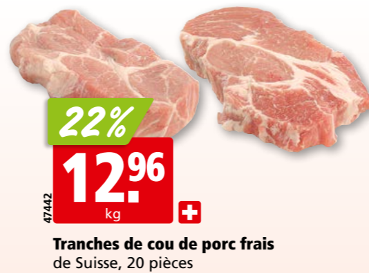
Tranches de cou de porc frais de Suisse, 20 pièces