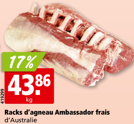
Racks d'agneau Ambassador frais d'Australie