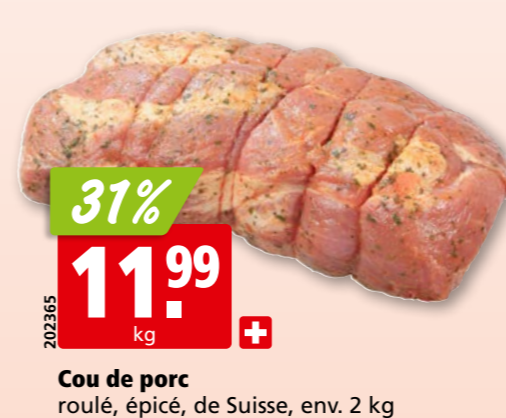
Cou de porc roulé, épicé, de Suisse, env. 2 kg