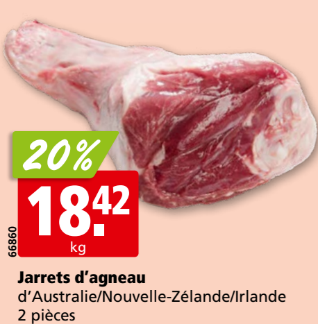
Jarrets d'agneau d'Australie/Nouvelle-Zélande/Irlande 2 pièces