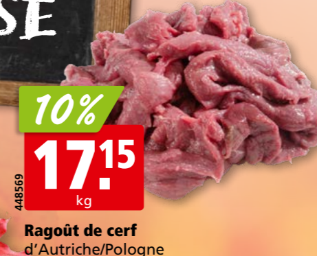
Ragoût de cerf d'Autriche/Pologne