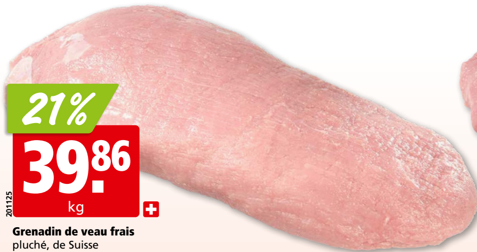
Grenadin de veau frais pluché, de Suisse