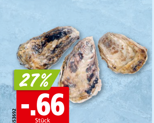
Miesmuscheln Bouchot frisch vom Mont-Saint-Michel AOP, Frankreich