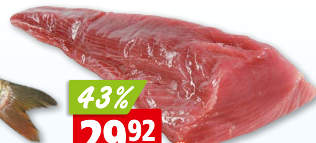
Karpfen frisch gezüchtet, ausgenommen aus Frankreich/Ungarn/Tschechien