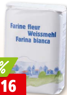
Weissmehl GMSA Typ 480, 10 x