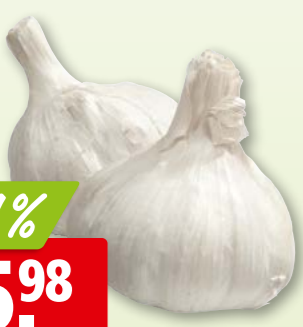
35724 Knoblauch Auswahl aus Spanien, ca. 5 kg