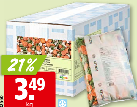
82560 Ditzler Sommergemüse tk, 2 x 2.5 kg