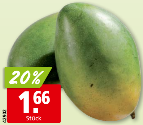
42902 Mangos Jumbo aus Brasilien, 6 x