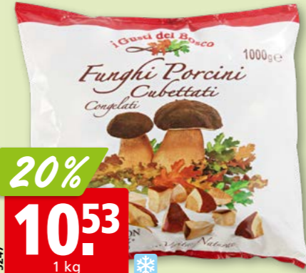
75247 Le Dragon Steinpilze Würfel, tk, 5 x