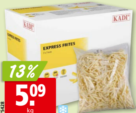
75428 Kadi Express Frites tk, 5 x 2 kg