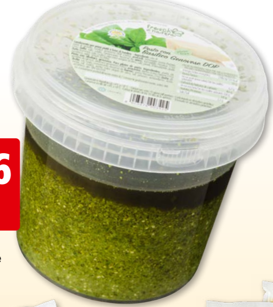
82328 Freschi di natura Pesto alla Genovese