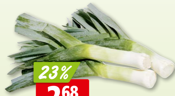
251022 Grüner Lauch aus der Schweiz, ca. 6 kg