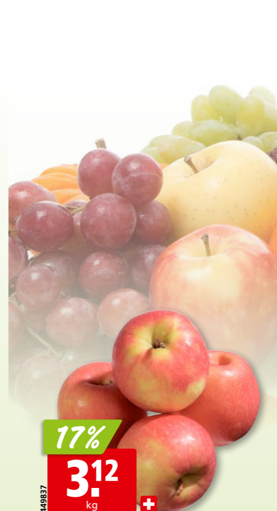
449837 Äpfel Pink Lady I aus der Schweiz, ca. 6.5 kg