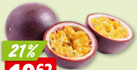
2212 Passionsfrüchte Extra aus Vietnam, ca. 2 kg