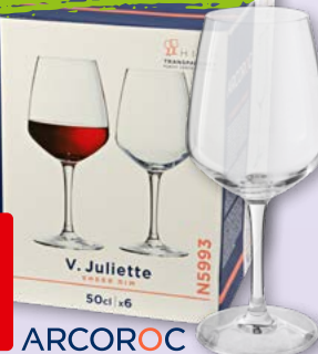
Weinglas 50 cl, 6 x