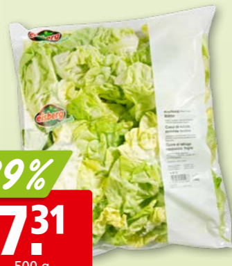
42764 Kopfsalatherzen hergestellt in der Schweiz