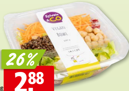
455236 Vegan Bowl hergestellt in der Schweiz