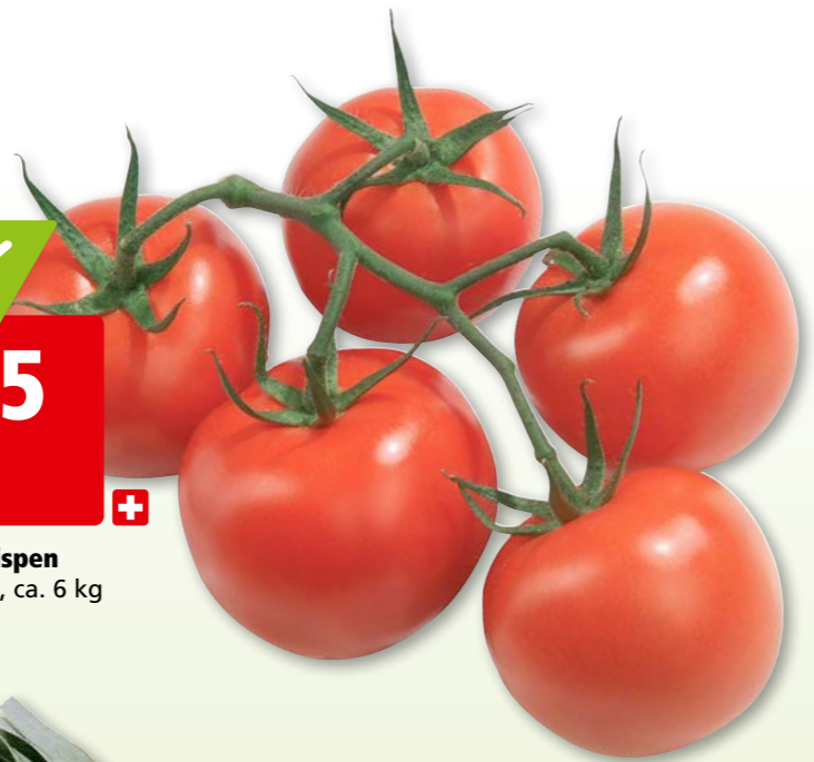
2278 Tomaten mit Rispen aus der Schweiz, ca. 6 kg