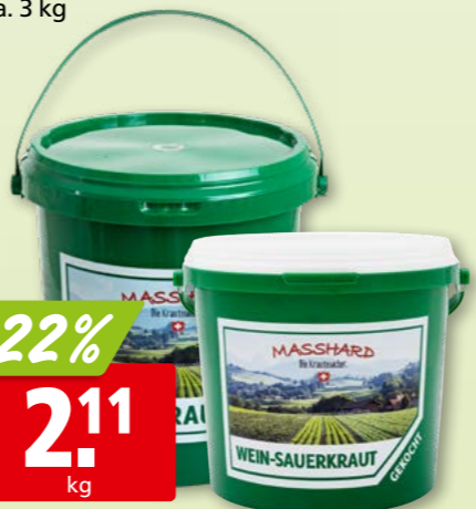
446442 Masshard Sauerkraut roh, 10 kg (Weinsauerkraut, gekocht, 5 kg: 2.57/kg, 21%)