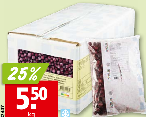
82447 Ditzler Kirschen schwarz entsteint, tk, 2 x 2.5 kg