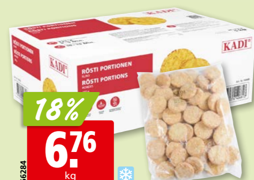
66284 Kadi Rösti-Galetten Gastro tk, 2 x 2.5 kg