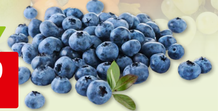
26472 Heidelbeeren aus Peru/Südafrika, 12 x