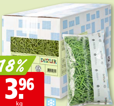
82406 Ditzler Bohnen sehr fein, tk, 2 x 2.5 kg