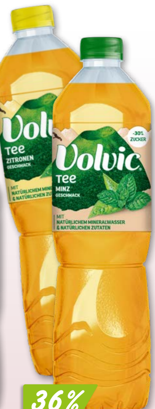
Volvic Tee Minz- oder Pfirsichgeschmack, 4 x 6