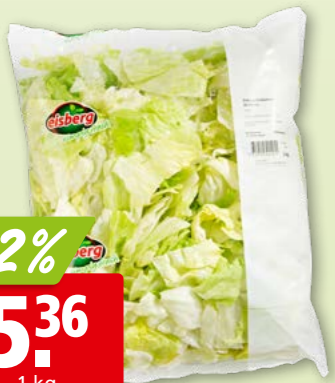
421600 Eisbergsalat geschnitten, 30-50 mm hergestellt in der Schweiz