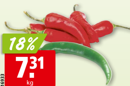
16933 Chili-Schoten rot oder grün, aus Spanien/Niederlanden ca. 3 kg