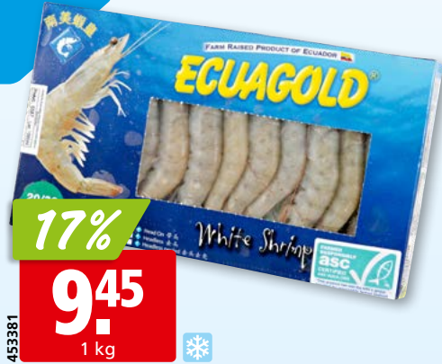
Ecuagold Gambas, 20-30 ganz, ASC, aus Ecuador, tk

Anlieferung frischer Fisch ab Dienstag Mittag.