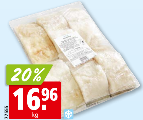
Stockfisch-Portionen entsalzt, tk, ca. 2 kg