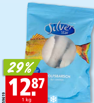
Silver Star Wolfsbarschfilets, 80-100 g tk