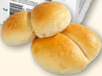
Romer's Weggli gebacken, tk, 25 x