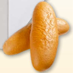
Kern & Sammet Sandwichbrot tk, 16 x