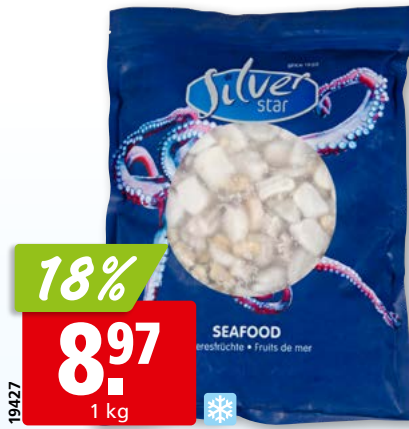
Silver Star Meerfrüchte-Cocktail tk