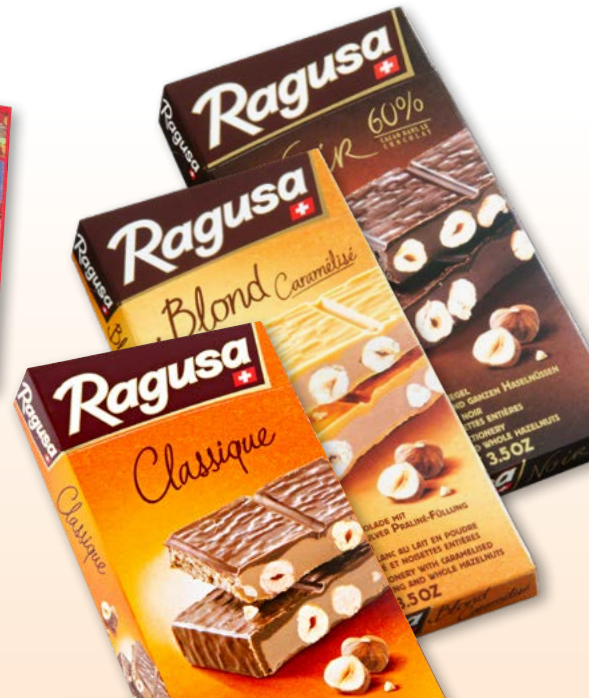
42824 Munz Tafeln Swiss Premium Assortiment, 5 x