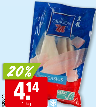
Le Dragon Pangasiusfilets, 120-170 g ASC, aus Vietnam, tk, 10 x