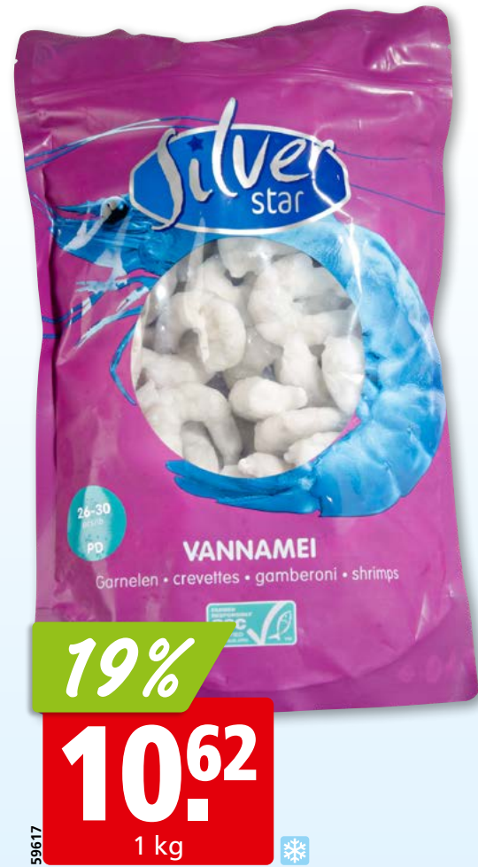
Silver Star Krevettenschwänze Vannamei, 26-30 geschält, ASC, tk, 10 x