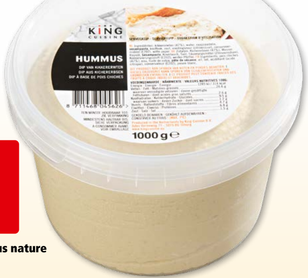
King Cuisine Hummus nature