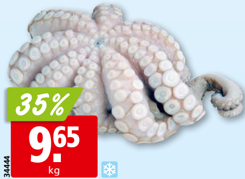
Canosa Tintenfisch, 1-2 kg tk