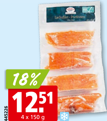
Lachsportionen ASC, ohne Haut, aus Norwegen, tk, 12 x