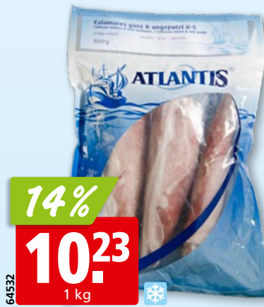
Atlantis Kalmare ganz, ungeputzt, tk, 10 x