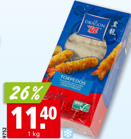
Le Dragon Krevetten paniert, 21-25 ASC, aus Vietnam, tk