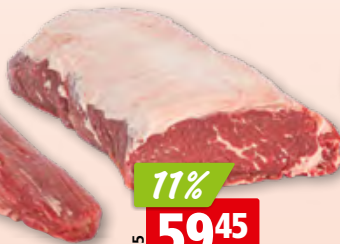
Rindsfilet Black Angus frisch aus den USA