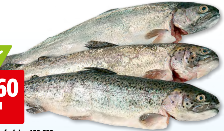
Truite saumonée fraîche, 180-350 g vidée, de France