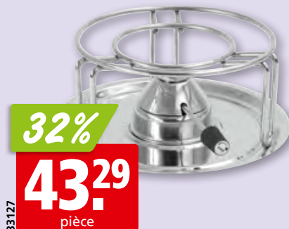
Caquelon à bourguignonne/chinoise Kisag 2.7 l