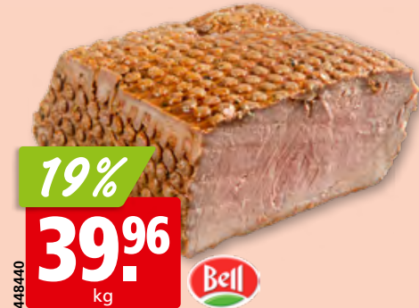
Bresaola della Valtellina IGP Negroni 1/2, env. 1.5 kg