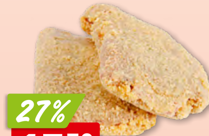
Schweinskoteletts frisch aus der Schweiz, 12 Stück