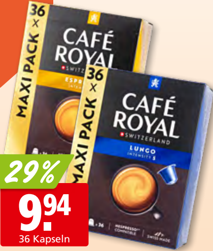
Café Royal Kaffee kapseln Lungo oder Espresso