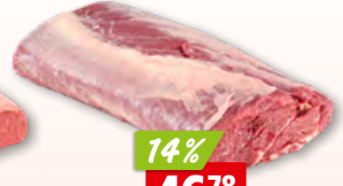
Entrecôte aus Irland