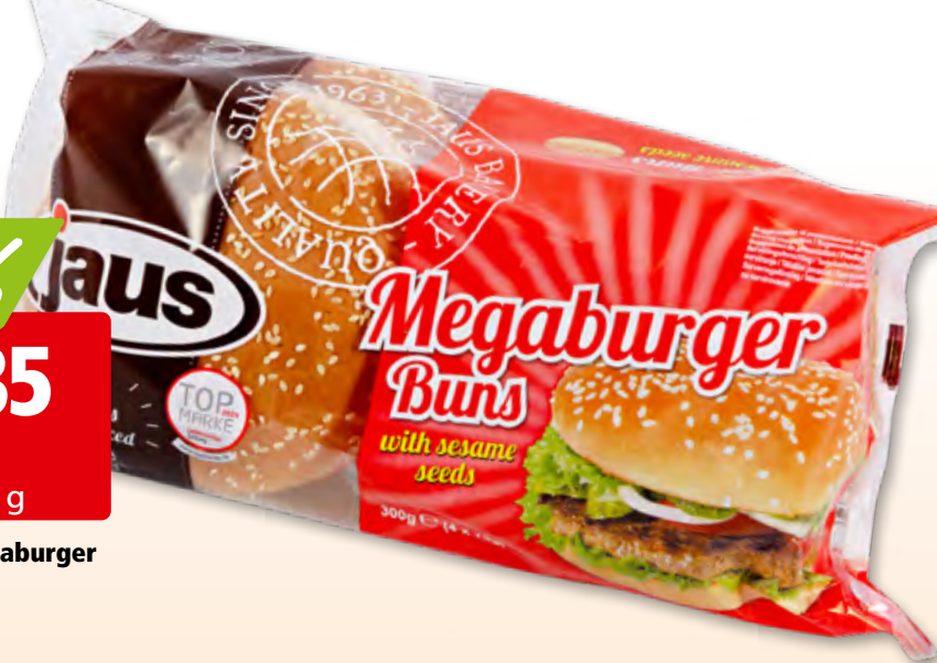
Jaus Buns Megaburger mit Sesam