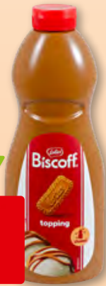
Lotus Biscoff Topping