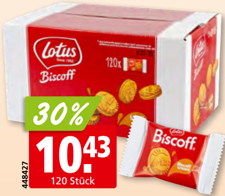
Lotus Biscoff Cream