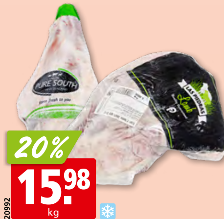
Lamm-Gigot ohne Bein, aus Neuseeland/Australien/ Irland/Uruguay, tk (mit Bein: 14.91/kg, 22%)