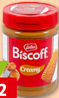
Lotus Biscoff Aufstrich Creamy