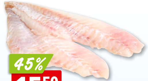
Rote Forellenfilets frisch mit Haut, aus Frankreich