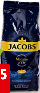
Jacobs Kaffeebohnen Médaille d'Or