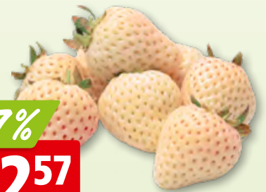
Erdbeeren weiss sortiert, aus Spanien