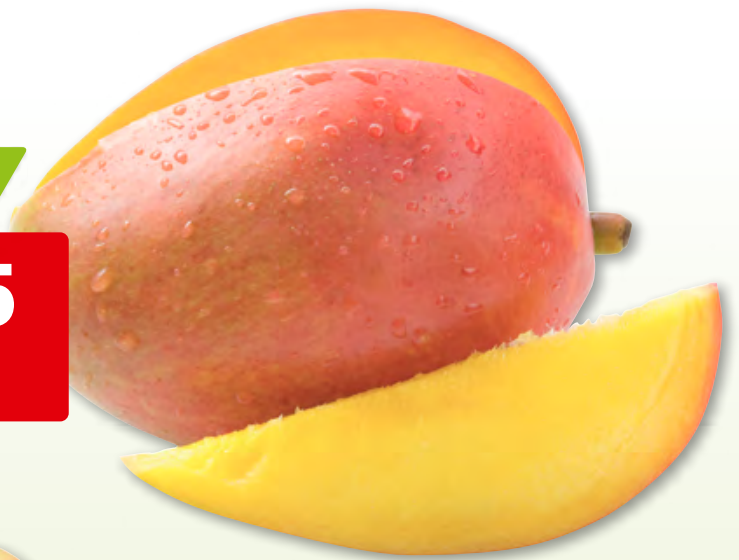
Mango Extra aus Peru, 12 x