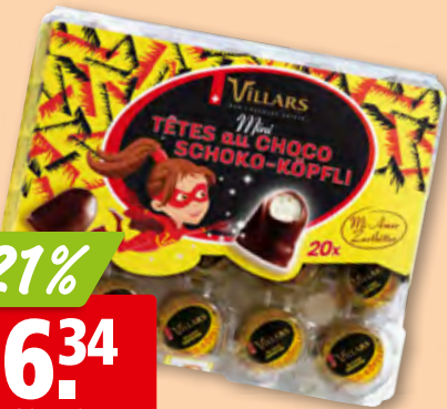
Villars Mini Schoko-Köpflli Original