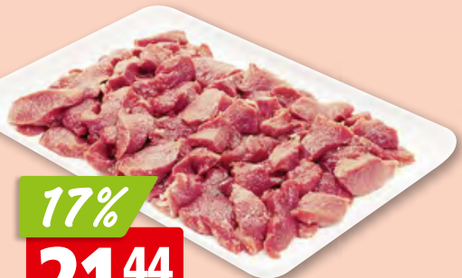
Lamm-Ragoût aus Irland/Australien/Neuseeland/ Grossbritannien, tk