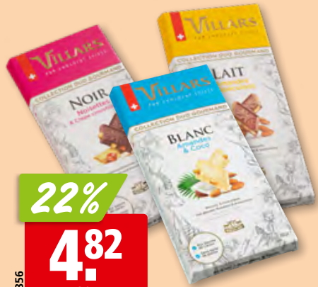
Villars Schokolade weiss, Milch oder zartbitter, 2 x