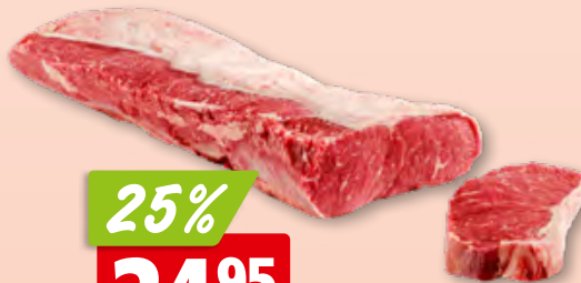
Rindfleisch Gastro frisch zum Schnetzeln à la Minute aus der Schweiz/Deutschland/Österreich