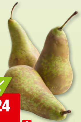
Birnen Conférence I aus der Schweiz, ca. 6 kg