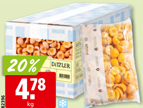
Ditzler Aprikosen halbiert, tk, 2 x 2.5 kg