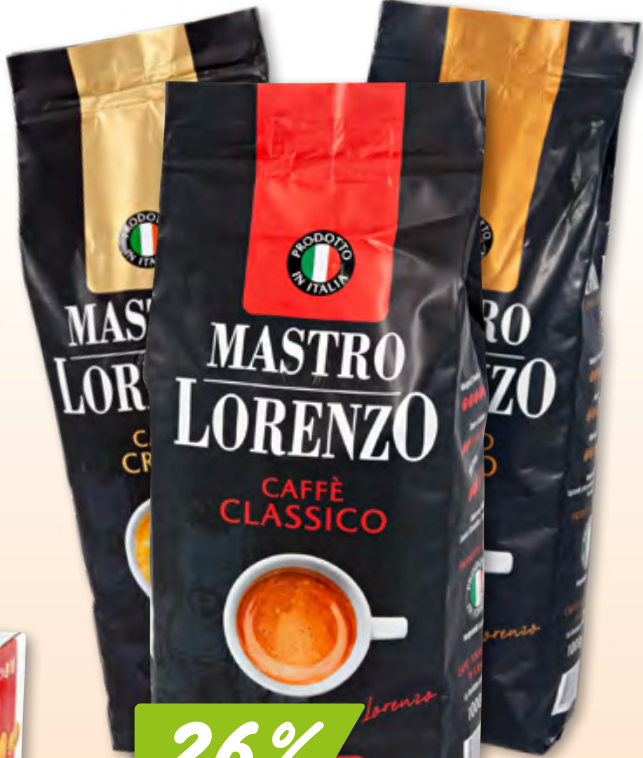
Mastro Lorenzo Kaffeebohnen Classico, Crema oder Intenso