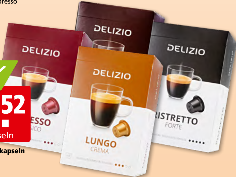
Delizio Kaffee kapseln diverse Sorten